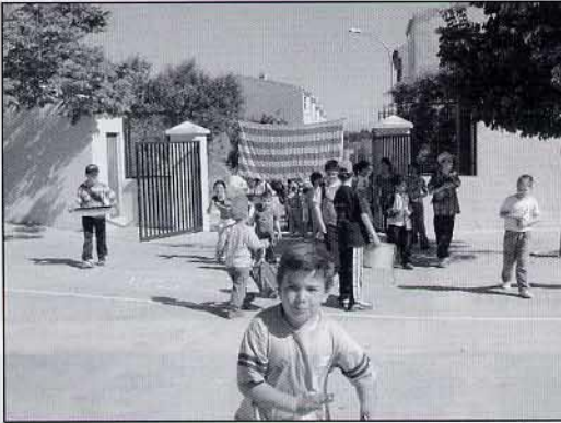
Els xiquets de Vilanova i Torre arriben a la Pobla.

llat i no massa calorós. L'AMPA ens va comprar un "polo" molt fresquet per acabar de dinar. Va haver un problema: l'autobús va fer "patir" els xiquets i mestres de Benlloch, Vilanova i la Torre. Per la seua culpa van arribar a sa casa molt tard.