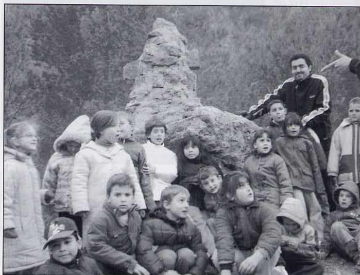
Al voltant de l'home de pedra.