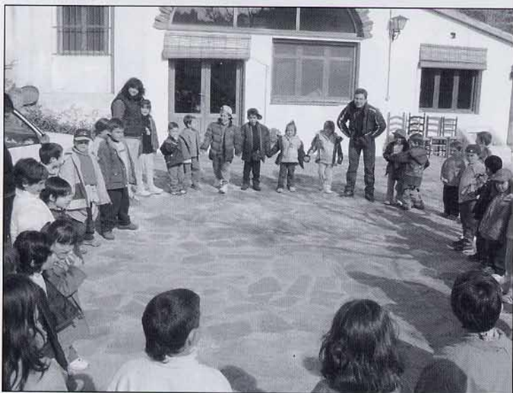
Moment d'acollida en baixar de l'autobús.

Quan encara estàvem dinant, va arribar l'autobús. El temps va passar ràpidament i ens van quedar moltes coses per veure. Bé un altre any serà.