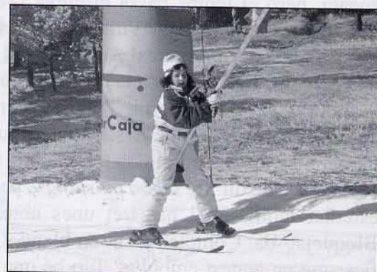
Què divertit !!!