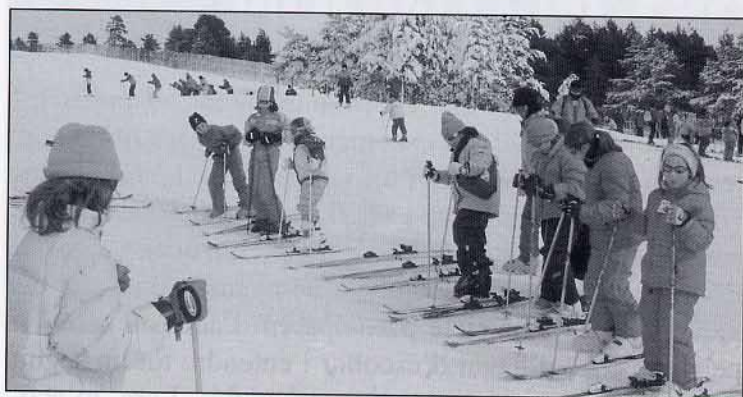
Atenció, comencem les classes!!