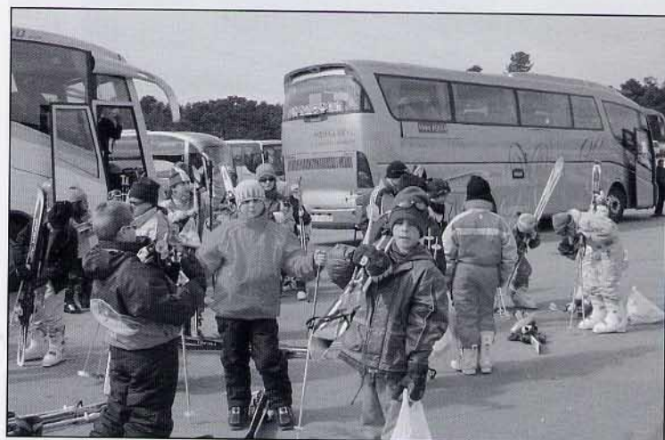
Descarregant els esquís.