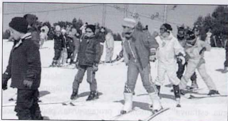
Alguns ja van a soles.... i sense pals!!