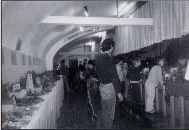
Ooooh! El Betlem té moviment!