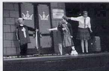
Ens vam convertir en artistes improvisats.