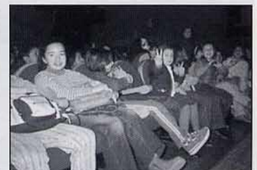
Esperant que comence la funció.