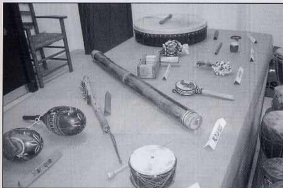
Els diferents instruments de percussió, despertaven la curiositat de la gent.