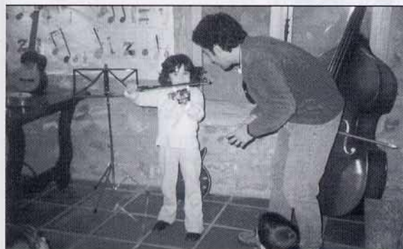
Santi ens va ensenyar com es toca el violí.