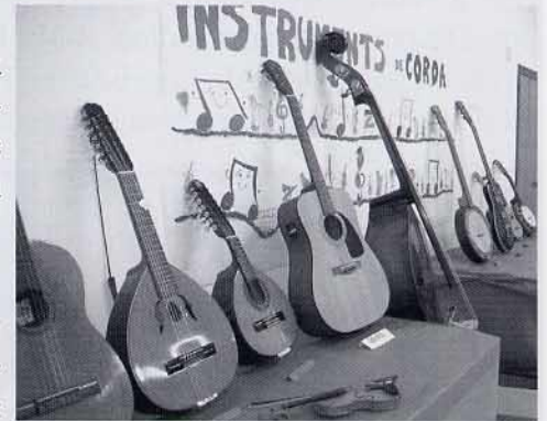
Molts i variats instruments de corda

En el saló de la banda van gaudir de l'exhibició d'un jove músic percussionista que viu la música dins d'ell.