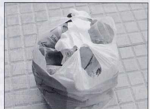
Pel camí vam trobar moltes deixalles, cartuxos, brics, llaunes...; vam replegar el que vam poder per tirar-ho el fem de l'escola