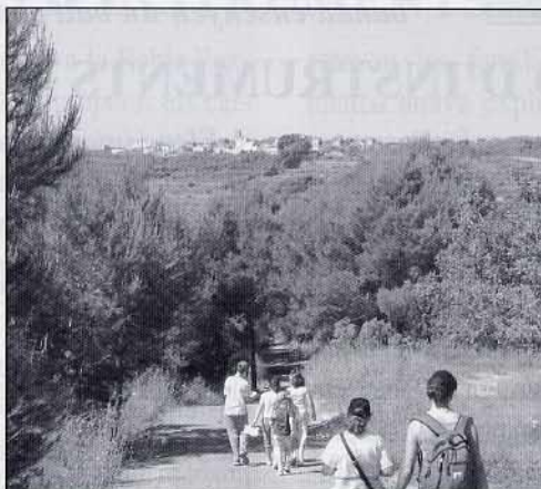
Una mica cansats, tornant cap al poble.