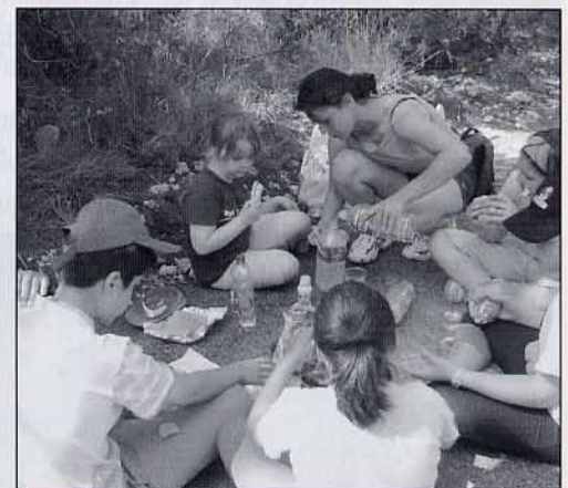
Esmorzant els entrepans i les sorpreses que vam trobar al rastreig.