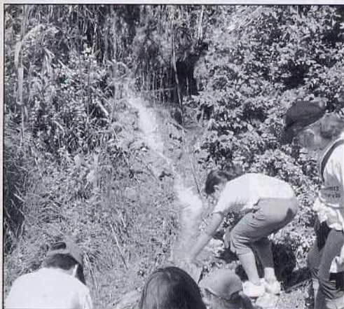
Refredant-nos a un rierol que vam trobar pel camí