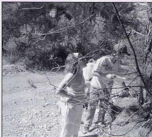
Cercant els missatges i els paquets sorpresa