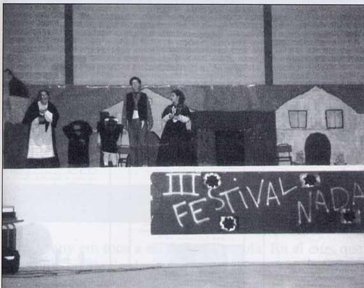
Ja hem actuat, quins nervis hem passat.