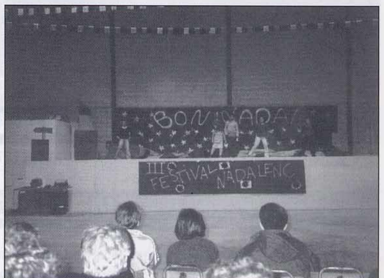
Ballant "The bongo son" ens ho vam passar molt bé, però també va ser cansat tant de tot...