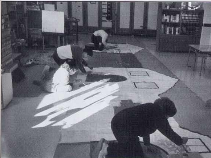
Pintant el gran decorat de l'obreta "El cigronet".

Per finalitzar les mares van fer xocolata per a tots, "actor", "actrius", i els nombrosos espectadors que vam vindre a veure-mos. Ens ho vam passar molt bé.