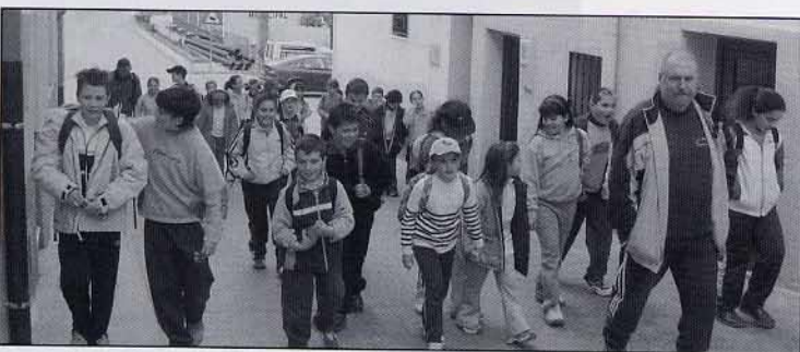
Anem de visita cap a l'Ajuntament i l'església.