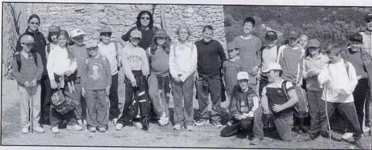
Fent camí cap a la Serra, vam parar al mas de...

Des de la llunyania admiràvem la silueta del nostre poble retallada en el cel i, a mig camí, vam dinar en un antic mas que havia estat