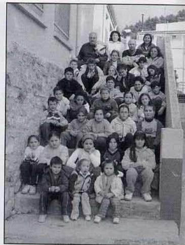
Anem de visita cap a l'Ajuntament i l'església.