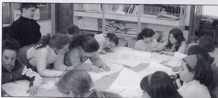
Dibuixem sobre el plànol del recorregut des de Vilanova a la Serra.

Vam sopar un entrepà. Quan vam acabar de sopar ens vam distribuir per les classes i també ens vam preparar el sac de dormir. Vam veure la televisió.