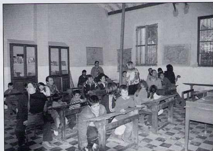
Emocionats per estar allí i seure en els pupitres.