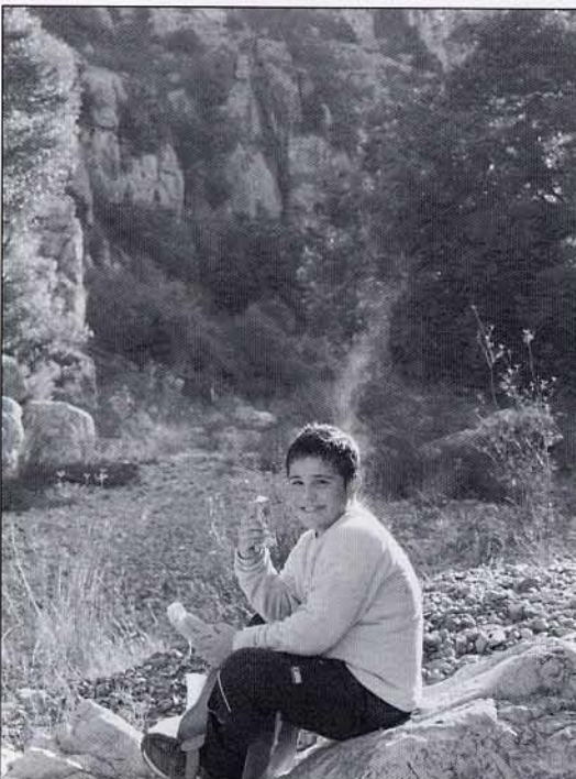
Esmorzant mentre el sol evapora la suor.