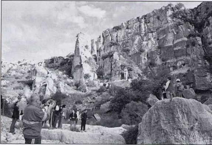
Magnífic penya-segat vist des de dins del barranc.

En el museu ens van fer una sessió de video explicativa de la prehistòria i les pintures, després vam anar a visitar la Cova dels Cavalls. En ella es conserven unes escenes de caça excel·lents, malgrat la mà de l'home que s'ha fet notar intentant escriure noms o arrancant trossos de roca.