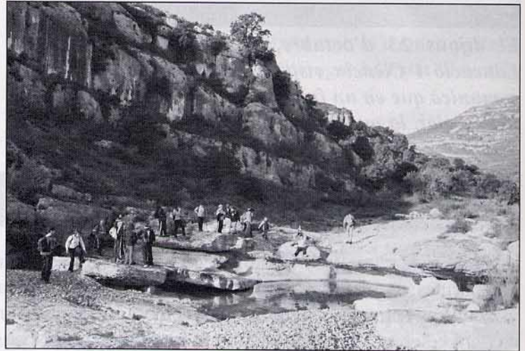
Superant un dels salts del barranc.