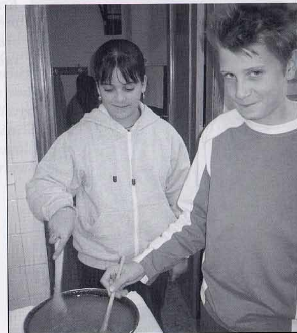
Què, ho fem bé?