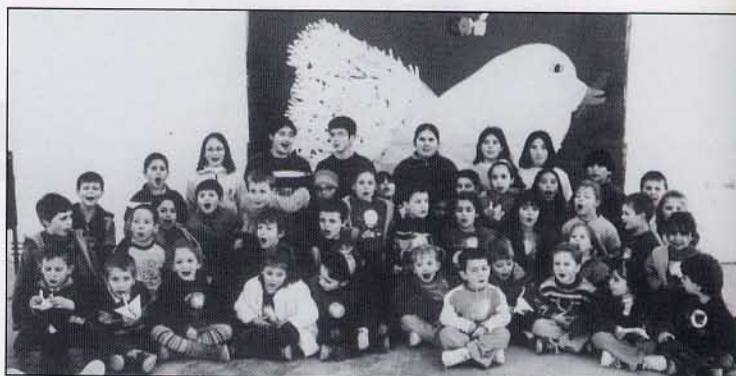
Des d'aquesta escola, volem desitjar-vos un món ple de PAU.