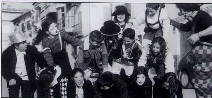
Per acabar, una torre humana vam muntar!