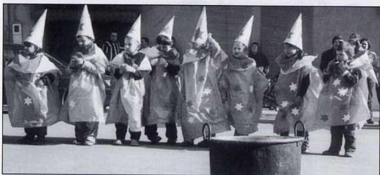
Trobarem la pòcima màgica?