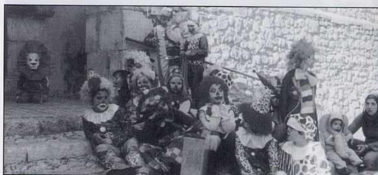
Al nostre circ no podien faltar ...els pallassos riallers.