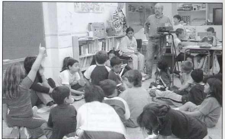
Amat contestant altres preguntes dels xiquets.