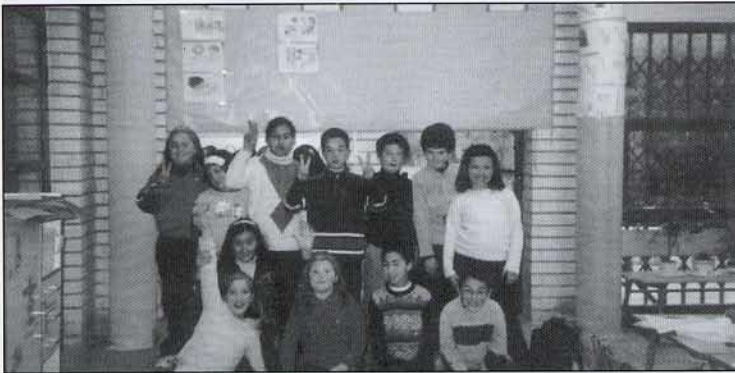
Tots volem eixir a la foto.