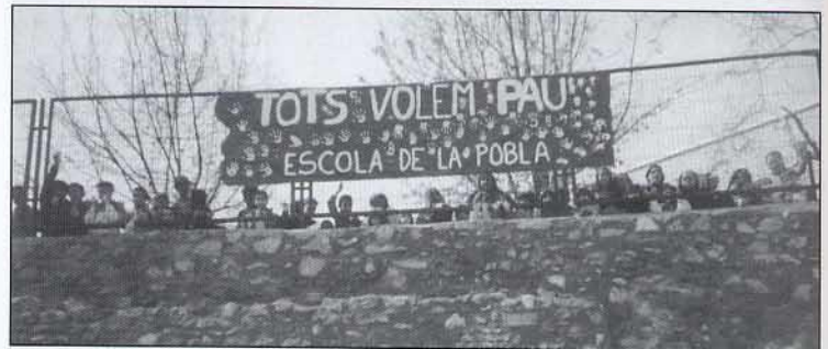
Totes les mans blanques demanant la pau.