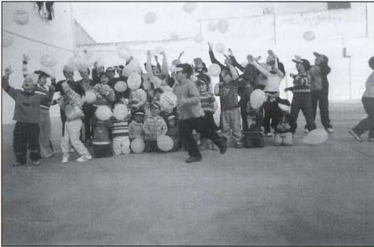
Els xiquets enlairen els globus amb desitjos de pau.