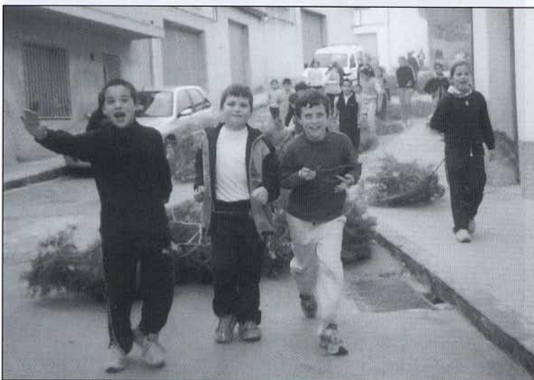
Seguint la tradició... d'argelagues un montó.