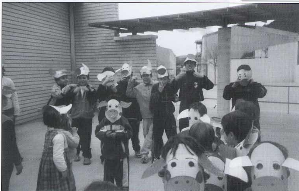
Els porquets de S. Antoni saludant al dimoni.